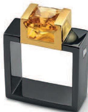
Zlatý prsten s černým rhódiem, citrinem a diamantem z kolekce Vertex.