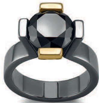
Zlatý zásnubní prsten Gothic s černým diamantem.