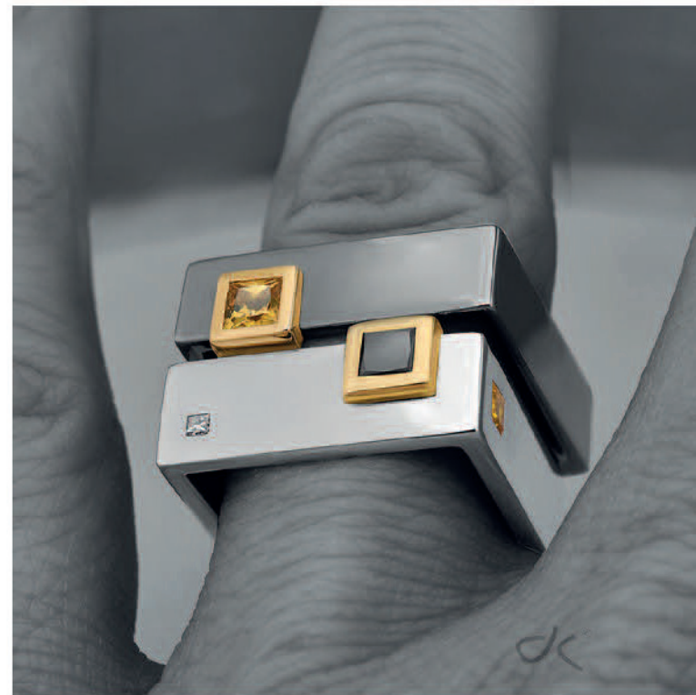
Unisexové zlaté prsteny s drahými kameny z kolekce Vertex.