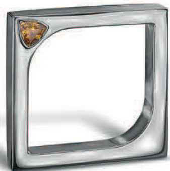
Prsten z bílého zlata se safírem z kolekce Eye To The Soul.