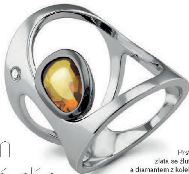
Prsten z bílého zlata se žlutým safírem a diamantem z kolekce Liberty.

Její umění oslovilo nejen hollywoodskou hvězdu Stevena Seagala a další osobnosti veřejného života, ale také profesionály. Její prsten Amulet Eye Ring Pendant z kolekce Eye To The Soul ocenili porotci proslulé mezinárodní soutěže A'Design Award Competition v Miláně zlatem.